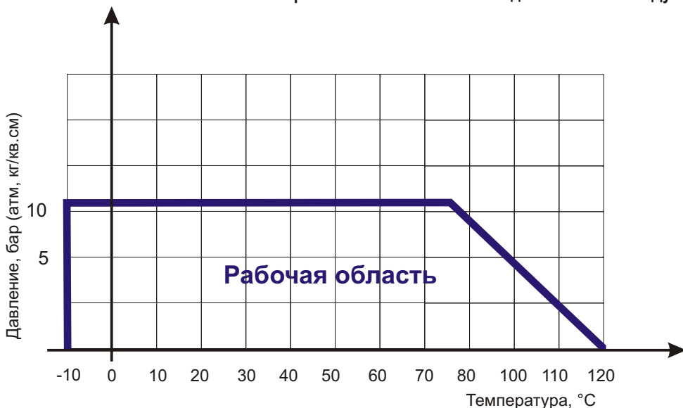
Диаграмма Давление / Температура для задвижки клиновой ABRA-A40-10G с обрезиненным клином и неподвижным штоком Ду200-600 Ру10:

Диаграмма определяет рабочую область для задвижек клиновых чугунных с обрезиненным клином в координатах Давление (в барах приборного) / Температура (° C).