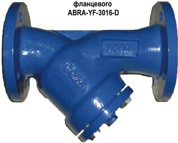
Внешний вид фильтра сетчатого чугунного фланцевого ABRA-YF-3016-D