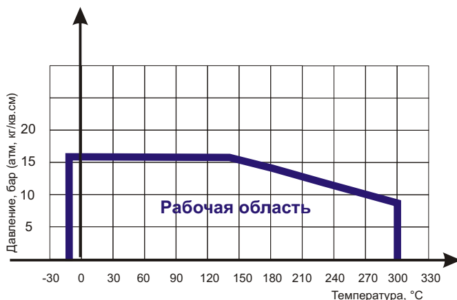
Диаграмма определяет рабочую область для фильтра сетчатого чугунного фланцевого в координатах Давление (в барах приборного) / Температура (° C).