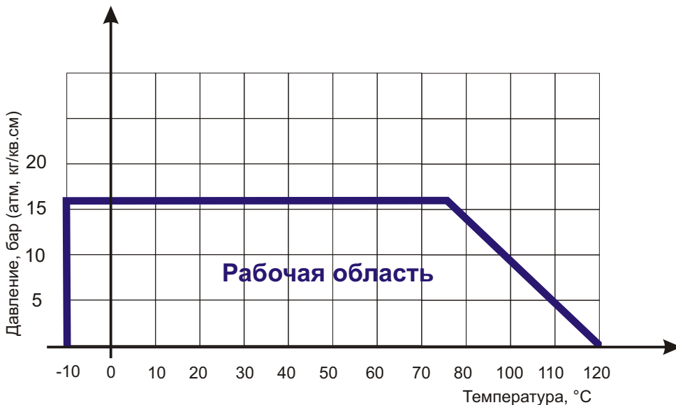
Диаграмма Давление / Температура для задвижки клиновой ABRA-A40-16G с обрезиненным клином и невыдвижным штоком Ду40-600 Ру16:

Диаграмма определяет рабочую область для задвижек клиновых чугунных с обрезиненным клином в координатах Давление (в барах приборного) / Температура (° C).